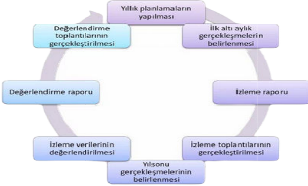
Şekil 4: İzleme ve Değerlendirme Süreci

Alternatiflerin ve çözüm önerilerinin geliştirilmesi.